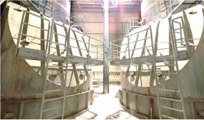
Foto der Anlage