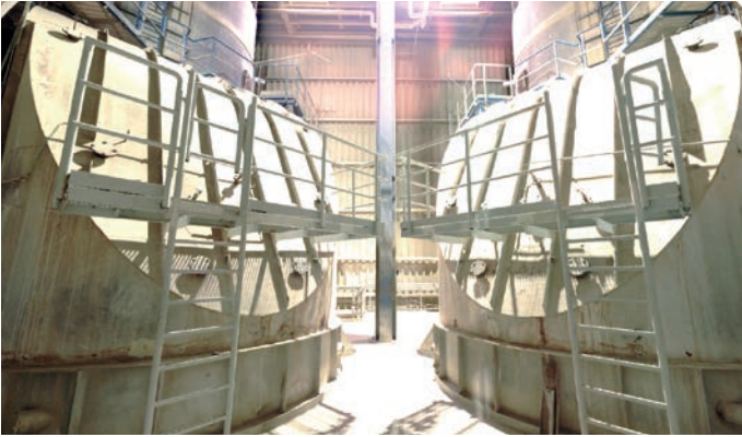
Foto der Anlage